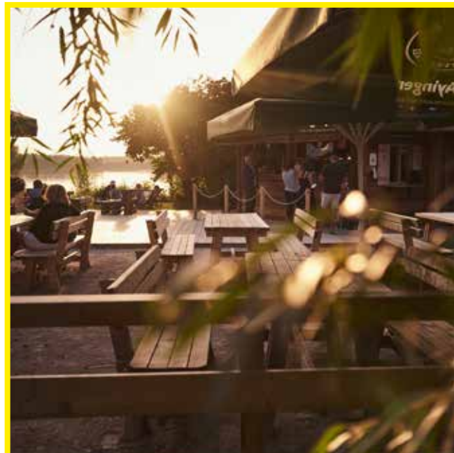
Terrasse mit Almtisch-Garnituren