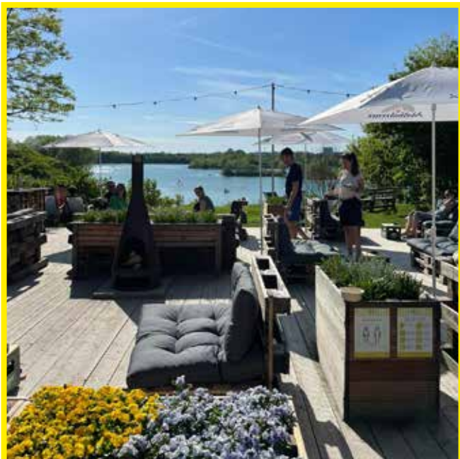
Terrasse mit Paletten-Möbeln